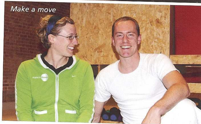
Make a move